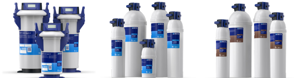
PURITY Quell ST

Dit is een overzicht met het volledige aanbod van PURITY-filtratieproducten, speciaal voor automaten ontworpen. BRITA Professional heeft de juiste oplossing voor u, en water dat perfect aansluit bij uw behoeften - ongeacht de samenstelling van uw drinkwatervoorziening.